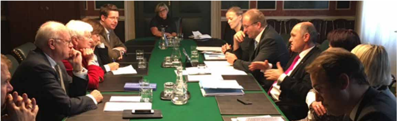
Der Vorstand der CSU-Landesgruppe im Gespräch mit dem österreichischen Innenminister Wolfgang Sobotka.