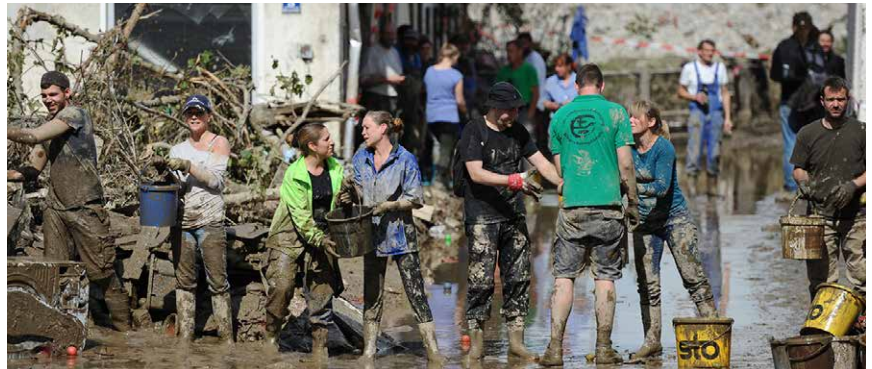
Aufräumarbeiten in Simbach am Inn